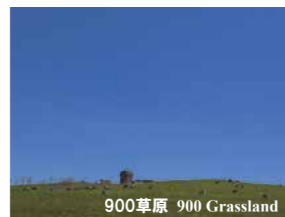
900草原 900 Grassland

Please enjoy Teshikaga using this timetable. The staff member at the Eco-Pass Station will help you with making your own itinerary. Please do not hesitate to ask for their help!!