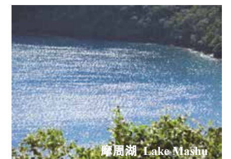
摩周湖 Lake Mashu