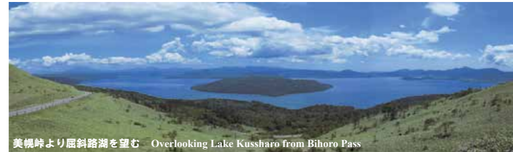
美幌峠より屈斜路湖を望む Overlooking Lake Kussharo from Bihoro Pass

Operation Period: Sat, Jul.15 ~ Mon, Oct.9, 2017