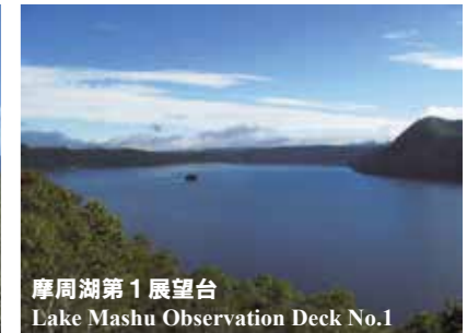
摩周湖第1展望台 Lake Mashu Observation Deck No.1