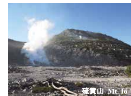
硫黄山 Mt. Io